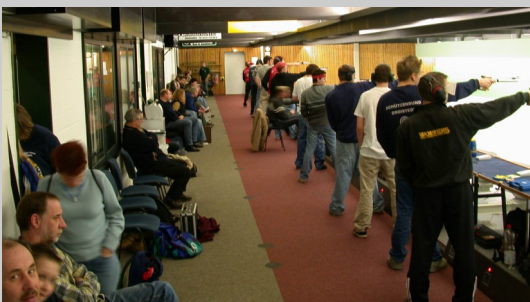
Die Luftdruckanlage in Braunschweig

07.04.2024 LP Männer, Junioren, Jugend LP Damen, Juniorinnen, Jugend Finale ( Damen; Herren, Jun. m+w) Siegerehrung